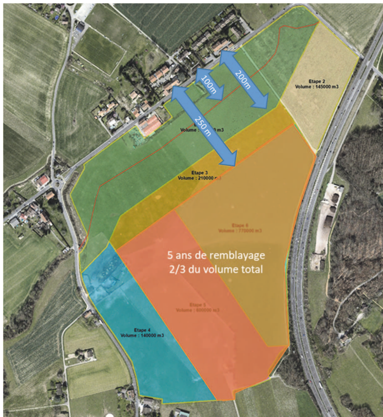
Figure 2 : Etapes d'exploitation

A ce jour, la commune de Bellevue est favorable au projet de décharge, et la commune de Collex-Bossy a accepté la proposition du service de géologie, sols et déchets (GESDEC) de participer à un groupe de travail qui sera mis en place pour finaliser le projet de décharge en vue de la mise à jour de l'étude de l'impact sur l'environnement.